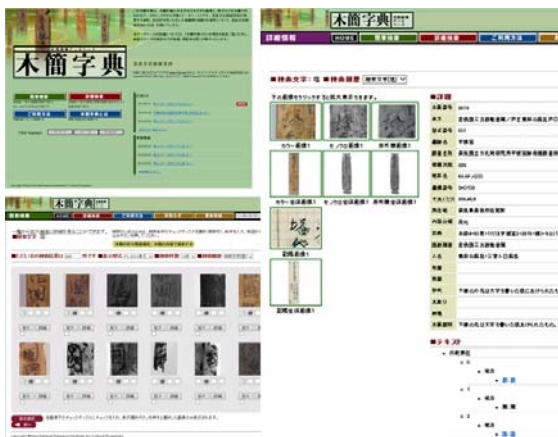
図3 画像データベース 木簡字典

上記のうち、前項のデジタル化した資源を最大限に活用したのが、「木簡字典」であり、前掲3科研における中心的役割を担っている。この「木簡字典」は、上記の「木簡データベース」からより画像に特化し、文字画像の検索ができる(図3)。複数文字検索にも対応し、テキスト中のどの文字列でも取り出せる。これは、各文字を切り出す際に得られる画像タイルデータから合成表示することによって実現している。その一方で1文字画像も自動的に集積している。