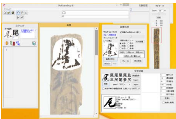
図 4 木簡積読支援システム Mokkanshop の GUI Figure 4 GUI of Mokkanshop

特に, 文字認識機能には, これまでの文字画像データから類似するパターンを検出するものであり, 木簡解読の担当者の脳裏を再現するものである. この脳裏を支える辞書を一層強化していくことによって, さらに解読の際の候補の幅が増えていくことが期待される.