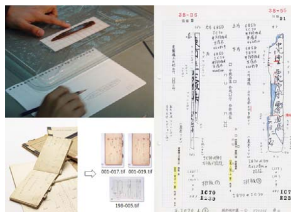
図1 記帳作業と記帳ノート

この記帳ノートは、用紙やファイリングの形式は変わりつつも、最初に記録がとられた約50年前から現在に至るまで蓄積されている。その数量もさることながら、長年の使用による紙の劣化も著しくなっていた。そこで、ノートのデジタルスキャニングを開始し、現在、過去のものほぼ完了している。