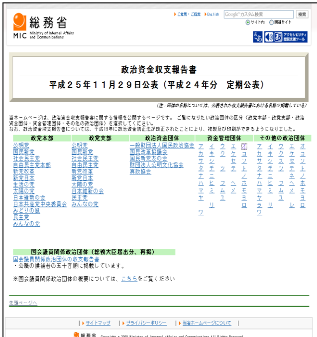
図 2 総務省 Web サイト政治資金収支報告書公開ページ

先にも論じたように、政治資金に関する情報の公開状況を確認すると、政治資金収支報告書の実物が電子化されて公開されている。