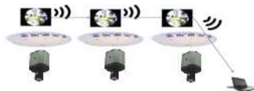
図 9. Multi-Hop 通信概要図

本システムでは、監視サーバから離れた複数地点のバルーンの映像を取得するために、バルーン間で Multi-Hop 通信を用いる。これにより、監視サーバと直接通信ができない遠隔地点のバルーンからの映像が取得可能となる。