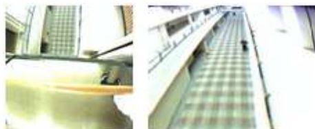
図 6. カメラ真下の画像(左)と拡大画像(右)

全方位展開処理は本研究室で開発された全方位ミドルウェアを使用して行われる [1] 。全方位展開処理を行うことで、図 5 のように、カメラから取得した環状画像をパノラマ画像に変換することができる。また、全方位展開処理にかえて、図 6 のように全方位展開時に切り捨てられる真下の画像を取得や、パノラマ画像の部分拡大等の機能も可能である。