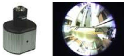
図 3. カメラ機器と魚眼レンズを装着した画像