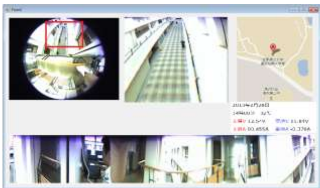
図 7. 監視ビューアの UI

本システムの監視ビューアは図 7 に示すように、一面面に円形画像、拡大画像、パノラマ展開画像を表示する。また、各バルーンの係留地点を示す地図を表示する。ユーザは円形画像の拡大したい部分を選択することで、部分拡大した映像を閲覧することができる。