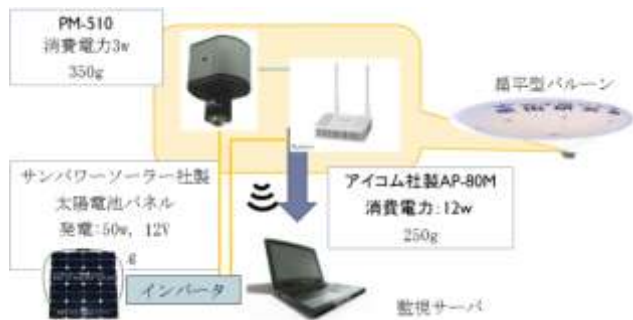
図 10.プロトタイプシステム構成図

本システムのプロトタイプは図 10 に示す通りである。使用するネットワークカメラは Arecont Vision 社の PM-510 で、2592×1944pixel, 1fps ずつ HTTP 接続で取得することが可能である。レンズは OPTART 社の FJ06-2K と呼ばれる魚眼レンズを装着する。太陽光発電パネルはサンパワーソーラー社のものを使用する。無線 LAN ルータは icom 社製の AP-80M を使用する。