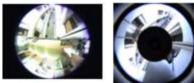
図 4. 魚眼レンズと PAL レンズの比較

本システムは図 3 に示すように、魚眼レンズを装着した全方位カメラを使用する。魚眼レンズを採用することで周囲 360 度の映像と、図 4 のように PAL レンズでは死角になるカメラの真下の映像を取得できる。