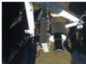
図 11.プロトタイプシステムのカメラユニット

本システムのプロトタイプは図 10 に示す通りである。使用するネットワークカメラは Arecont Vision 社の PM-510 で、2592×1944pixel, 1fps ずつ HTTP 接続で取得することが可能である。レンズは OPTART 社の FJ06-2K と呼ばれる魚眼レンズを装着する。太陽光発電パネルはサンパワーソーラー社のものを使用する。無線 LAN ルータは icom 社製の AP-80M を使用する。