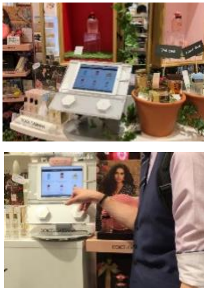
図1 香水売り場で用いられているタッチパネル式アロマサイネージシステム ([2]より引用)

近年、百貨店の香水売り場では、嗅覚ディスプレイとタブレットを用いたアロマサイネージ（香りの広告・宣伝）システムが導入され始めている[1]。大阪梅田駅にあるLucua イーレでは、Dolce & Gabbana の香水が体験できるアロマサイネージシステムが導入されている。また、同ブランドの大丸梅田店では、12種類以上の香水が体験できるデジタル香水テスターシステムが設置されている。これまでに、数多くあるブランド品から好みの香水を選ぶ際は、ムエット紙を使うことが多かった。しかし、ムエット紙のコストに加えサンプル品の消費量も多く、放出された大量のエアゾルが売り場に浮遊し、商品ごとの判別が困難になる場合がある[2]。こうしたことから、嗅覚ディスプレイ Aroma Shooter[3] とタブレット端末を組み合わせ、表示されている商品の画像をタップするだけで香りが体験できるシステムに優位性があり、新たなセールスプロモーションツールとしての事業展開が進められている（図1）。香水に限らず、柔軟剤、シャンプー、トリートメントといった様々な香り商品を、顧客に体験してもらえるメディアとして、活用範囲も広がっていくと考えられる。