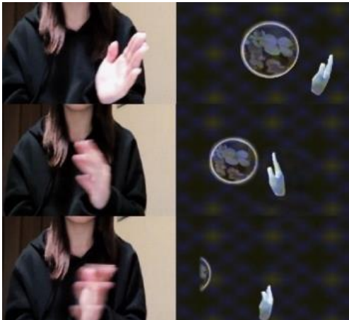
図 3 手で払って次の選択肢へ移動するジェスチャ

提案手法においては、この手で払う動作を、次の選択肢へ移動するジェスチャとして採用した (図 3)。