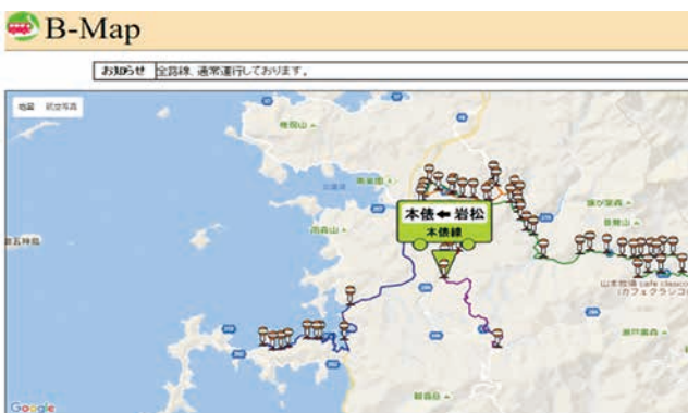
図-1 コミュニティバス運行管理システム (B-Map)

ICT コースは、実学経験を重視し、ICT 分野の深い専門知識と他分野の幅広い知識を兼ね備え、ICT を活用して新たな付加価値を生み出せる高度な実践的能力を持つ T 型人材を育成することを目的として、2009 年に設置された教育コースである。2012 年から、宇和島市役所の職員を顧客とした実課題 PBL を取り入れており、これまでにさまざまな業務を支援するシステムを、学生が主体となって開発してきた。そのうちの 1 つが、2013 年に開発を開始したコミュニティバス運行管理システム (B-Map) である(図-1)。このシステムはすでに実運用されている。また、実運用と並行しながら、宇和島市役所の職員に対するヒアリングを実施し、持続的に改良を続けている。開発は、ICT コースに所属する M2 と M1 の混成チームで行っている。混成チームとすることによって、M2 の学生にはリーダーシップを、M1 の学生にはフォロワーシップを身につけさせることができる。また、組織的な