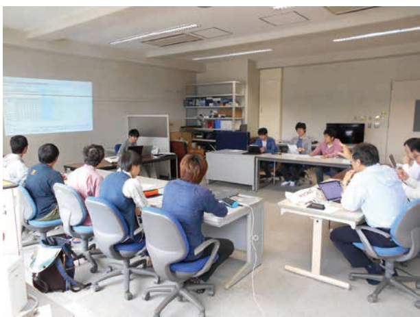
図-4 地域課題ゼミの実施風景

2018年度の地域課題グループでは、取り組むべきテーマが3つあるため（水産業支援に関する研究と、重工業の企業2社それぞれとの共同研究）、所属グループ決定からさらに約1カ月後にチーム分けを行い、3つのチームを構成した。これらのチーム