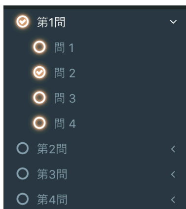
図 3 解答ナビゲーション