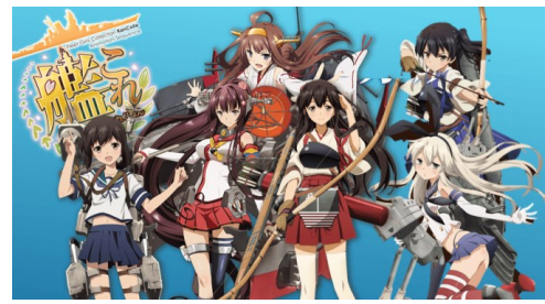
図9 艦隊これくしょん

第二次世界大戦時の大日本帝国海軍の軍艦を女性キャラクターに擬人化して“艦娘”と呼ばれる女の子がメインキャラクター。その“艦娘”たちにめぐって繰り広げられる日常生活や悪勢力と戦う運命を描く作品である。本作品の原作は同じタイトルのブラウザゲームで、ゲームユーザーから絶大な支持を得られている。作品のなかでは、男性キャラクターは“提督”一人しか出場していない。一見女性キャラクターをまとめる役だが、顔も声も一度も出ていない。ゲームの設定の影響もあるが、視聴者に感情移入するための男性キャラクターでもある。主人公の“吹雪”は最初から何にもできず、弱小な立場に立っていた。友たちの励みと自分の努力のおかげで、最終的に周りに信頼され艦隊を率いる立場になっていた。