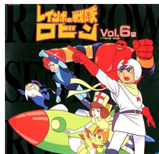
図3 “レインボー戦隊ロビン”

“レインボー戦隊ロビン”（1966）では，女性のリリ（ロビンへの母性を持たされたロボット）は救護のみで戦わない．“科学忍者隊ガッチャマン”（1972）から，女性が戦いに参加するパターンが始まった．その後，“超人戦隊バラタック”（1977），“合身戦隊メカンダーロボ”（1977）などの戦隊ものはそのパターンを引き継いだ．つまり，戦後アニメのなかでは女性は最初の男性の引き立て，サポート役から徐々にヒロインに転身してきた．アニメの中でも女性の地位が上がってきたのだ．