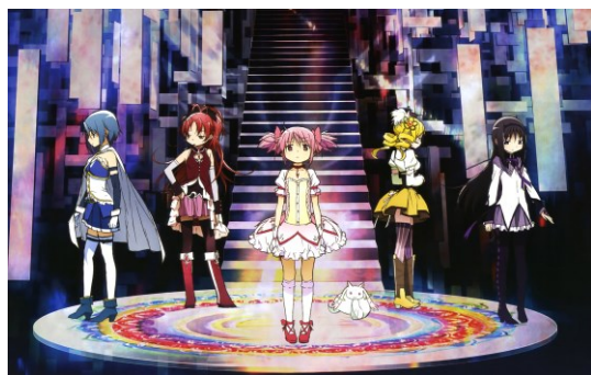
図7 魔法少女まどか☆マギカ

少女ものというよりも魔法少女をモチーフにしたダーク・ファンタジーとしての作風が色濃い。[7]