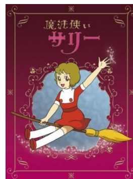
図5 “魔法使いサリー”

アメリカ製作のコメディドラマ“奥様は魔女”が日本国内でもヒットしたことを受け，東映は魔法使いを扱ったアニメ作品の制作を企画した．[3]この“魔法使いサリー”が日本初の魔法少女アニメ，また日本初の女子を主演においたアニメ作品とも言われる作品にも該当する．しかしこの作品は女性をメインターゲットにした作品でありながら，バラエティに富んだ作品性から，男子層からの人気も得ていたとされる．女性を描く物語は女性だけではなく，男性にも愛読されていることがこの時期から始まったとも言われる．