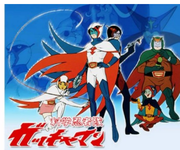
図4 “科学忍者隊ガッチャマン”

その他，1966年から1981年までの15年間断続的に続いた東映魔法使いシリーズがあった．このシリーズは，1970年代から世に出ていた魔法少女アニメの原点とも言われる．